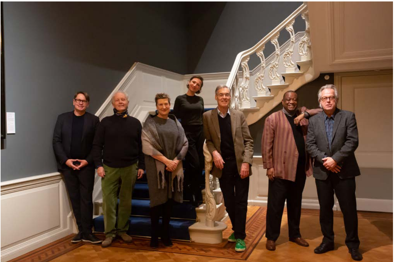
De jury van 2021

De tweede manier waarop wij aan educatie doen is via alle inspanningen om jong zangtalent te helpen ontwikkelen en kennis aan hen over te dragen. (Dit zijn 2 van de drie O's van onze missie: Ontdekken, Ontwikkelen en Overdragen ) Hiervan kon een deel gelukkig wel doorgaan. Uiteraard waren er weer masterclasses met topartiesten tijdens de competitieweek. Daarnaast draagt de IVC geregeld bij aan de mogelijkheid voor jonge zangers om 'vliegreun' te maken en gedurende het jaar hun vak op diverse podia te beoefenen tegen een vergoeding die voldoet aan de normen van de Fair Practice Code.